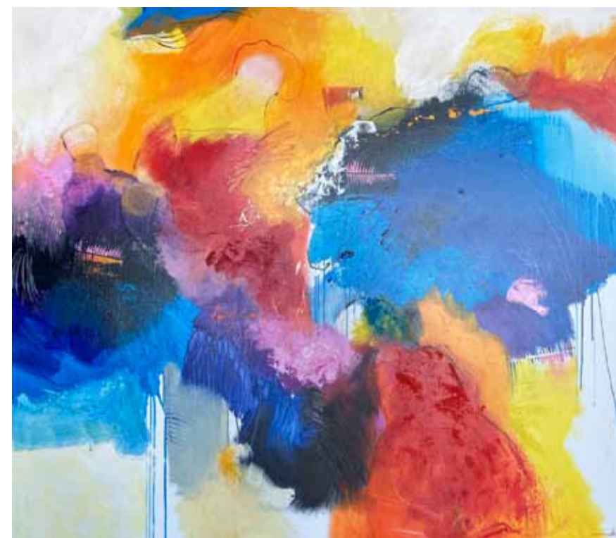
Jos van Beek, Zomers spektakel.

raire bronnen zoals de fabels van Toon Tellegen. Haar wereld is een herkenbare blije 'wereld-in-de-wereld', vol van haar verwondering over alle mogelijkheden en onmogelijkheden die kunnen bestaan, en die zij verbeeldt met grote vindingrijkheid, fantasie en humor.