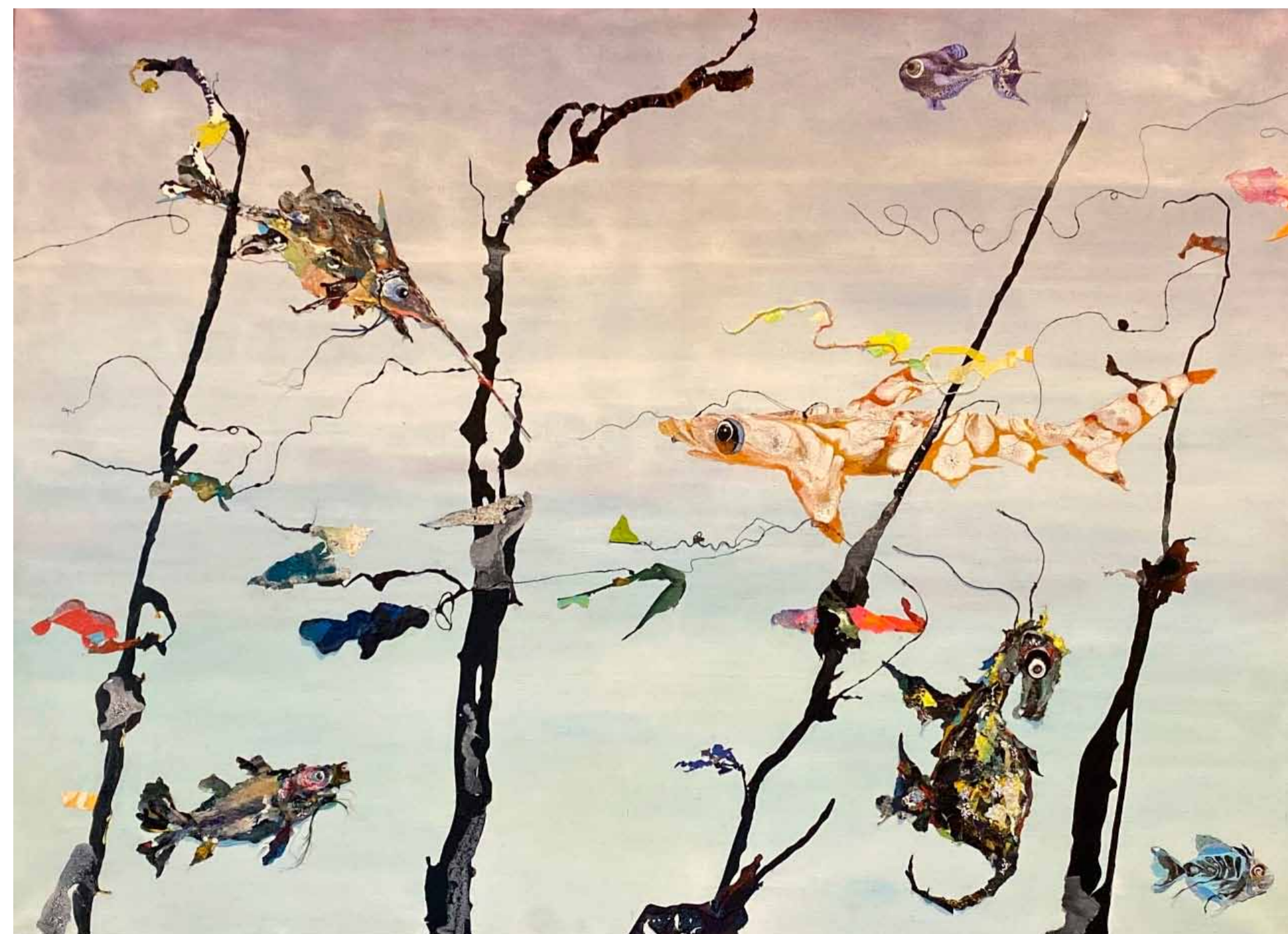
Nel Kamphuis, Speelkameraden.

deze expositie wordt bepaald door de begrippen fascinatie en verbeelding. Nel Kamphuis laat zich inspireren door de wonderde wereld der natuur en soms door lite-